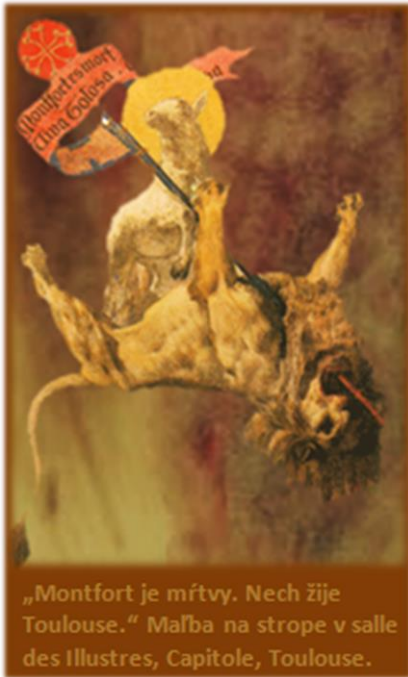
„Montfort je mŕtvy. Nech žije Toulouse.“ Malba na strope v salle des Illustres, Capitole, Toulouse.

Ac dins una peireira, que fe us carpenters Qu'es de Sent Cerni traita la peireira e •l solers E tiravan la donas e tozas e molhers E venc tot dreit la peira lai on era mestiers E feric si lo comte sobre l'elm qu'es d'acers, Que •ls olhs e las cervelas e •Ls caichals estremiers E •l front e Las maichelas li partic a cartiers; E •l coms cazec en terra mortz e sagnens e niers.