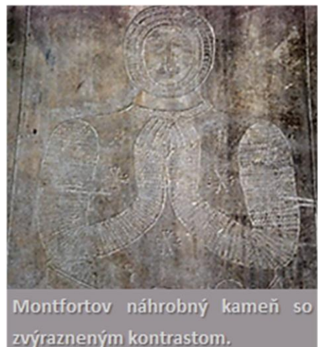
Montfortov náhrobný kameň so zvýrazneným kontrastom.